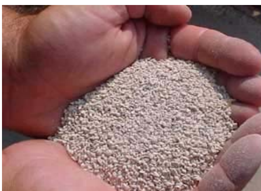
شکل ۱: بترتیب بالا از چپ، P.V.C. سنگ مرمر (marble)، پایین از چپ سنگ آذرین (scoria)، سنگ زئولیت (zeolite)

آب سیستم در حدود ۱۳۰ لیتر و سرعت چرخش سیستم در حدود ۷ لیتر در دقیقه بود به این ترتیب کل آب سیستم در کمتر از ۲۰ دقیقه از بیوفیلتر عبور می‌کرد. واحدهای بیوفیلتر در سبدهای ویژه پلی‌اتیلنی با ابعاد ۶۰×۴۰×۳۰ در مخازن ۲۲۰ لیتری روی ۵ پایه ۱۰ سانتیمتری قرار گرفتند (شکل ۲). ابتدا سنگ مرمر و سنگ آذرین و زئولیت در اندازه‌های ۰/۵ تا ۱ سانتیمتری خرد و با آب شیرین کاملاً شسته شدند. سپس خرده‌های سنگ در درون آب اسید رقیق (۲ تا ۳ نرمال) و یا کلر ۰/۲ درصد ضدعفونی شده و در نهایت با آب کاملاً شستشو شدند. سپس بستریهای مختلف در سبدهای پلی‌اتیلنی که درون آنها توری پلاستیکی تعبیه شده بود، قرار داده شد. برای هوادهی مناسب نیز یک عدد سنگ هوادهی بزرگ در بستر آنها قرار داده شد. همچنین دو عدد لوله کوچک با سیستم هوادهی و چرخش آب (Air Water Lift). A.W.L. در دو گوشه هر واحد بیوفیلتر نصب گردید (Otte & Rosenthal, 1979). این نوع هوادهی اولاً موجب هوادهی یکنواخت توده داخلی سنگ که محل تجمع کلنی باکتری است می‌شود و هم اینکه بوسیله سیستم A.W.L. آب محبوس شده در میان توده سنگ بوسیله