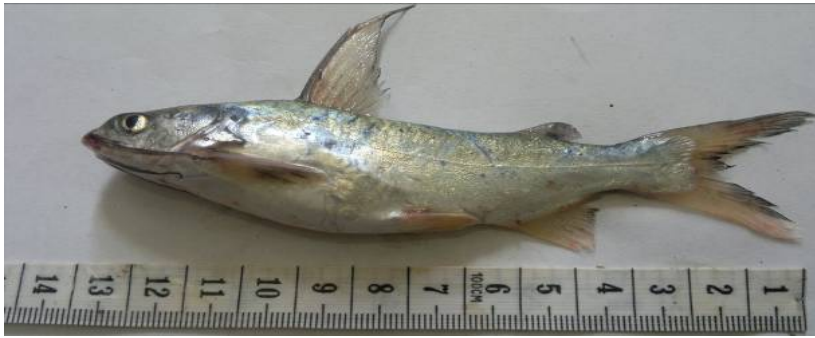
شکل ۲: گربه ماهی خالدار Arius maculatus صید شده از آبهای خلیج فارس

همچنین ماهیان دارای میانگین ( \pm انحراف معیار) وزنی برابر 42/9 \pm 56/1 گرم با دامنه تغییرات 9/3 - 190/1 گرم بودند. برخی خصوصیات ریخت‌سنجی نسبی این گونه جمع‌آوری شده از خلیج فارس در مقایسه با دیگر جمعیت‌ها در جدول ۱ ارائه شده است.