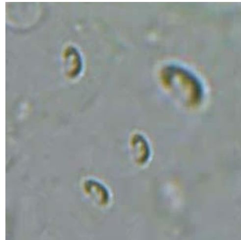
شکل ۳: انگل کاستیا ( Ichthyobodo sp. )