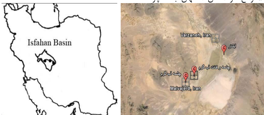
شکل ۱: محل نمونه برداری ماهی مولی ( Poecilia latipinna ) در قنات جرقویه اصفهان

۳۰ قطعه ماهی مولی در سال ۹۲ از قنات حسن آباد جرقویه با طول و عرض جغرافیایی 32^{\circ} 17/02' N و 52^{\circ} 37' 18/59' E واقع در استان اصفهان با ساچوک