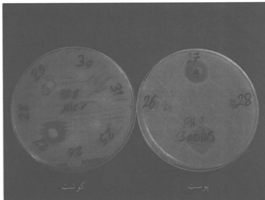
شکل ۱: نمونه‌ای از پلیت‌های حاوی نمونه‌های آزمایش و هاله‌های عدم رشد