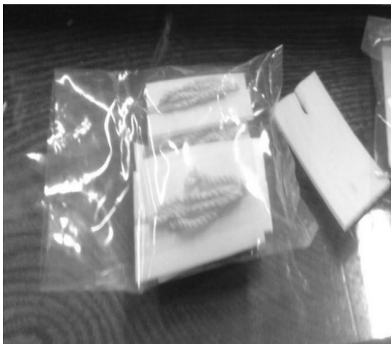
شکل ۳: نمونه نخ‌های مورد آزمایش