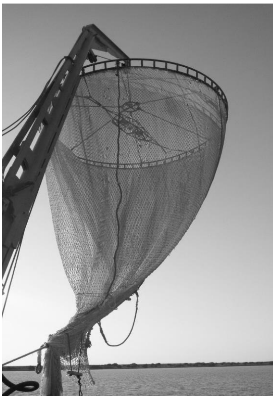
شکل ۱: تور بالابر مخروطی

استحکام در مقابل پارگی، یکی از مهم‌ترین ویژگی‌هایی است که صیادان و تولیدکنندگان تورهای صیادی باید به هنگام انتخاب یک تور صیادی مناسب به آن توجه کنند (Klust, 1982; Oxvig & Hansen, 2007). زیرا، ویژگی‌ها و خواص فیزیکی نخ های صیادی بکار رفته در تور بر روی راندمان صید و دوره‌ی بهره‌برداری اثر مستقیم دارند (امینیان فتیده، ۱۳۸۲).