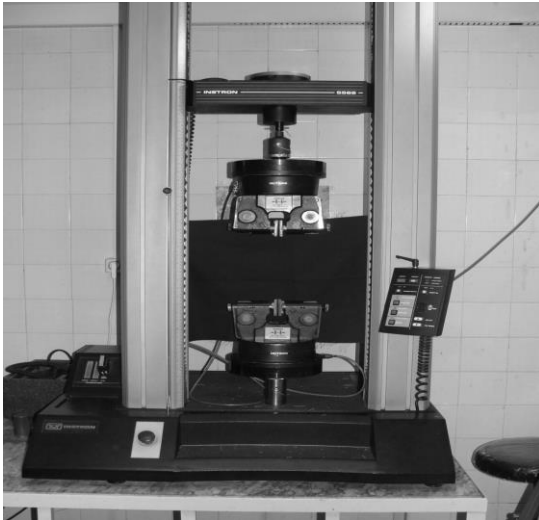
شکل ۲: دستگاه اینسترون موجود در دانشگاه صنعتی امیرکبیر