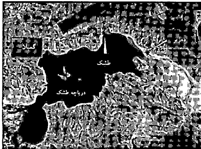
شکل ۱: تصویر ماهواره‌ای محدوده مطالعاتی و موقعیت جغرافیایی ایستگاههای نمونه‌برداری

مایع استریل شستشو داده شد. سپس سوسپانسیون باکتری بر طبق استاندارد ۰/۵ مک فارلند تهیه شده و از آن به صورت ۵ درصد (حجمی - حجمی) بعنوان مایع تلقیح اولیه به محیط‌های کشت استفاده گردید (Diaz & Grigson, 2000). برای انجام این آزمایش محیط کشت مایع ONR7a با غلظت‌های مختلف نمک NaCl (۰، ۴، ۶، ۸، ۱۰، ۱۲، ۱۴، ۱۶، ۱۸، ۲۰، ۲۲ درصد) به میزان ۱۰۰ میلی لیتر در ارلن‌هایی با حجم ۵۰۰ میلی‌لیتر تهیه شد (از هر کدام دو تا، یکی برای نفتالین و یکی برای آنتراسین). سپس به هر ارلن PAH مربوط به آن (نفتالین یا آنتراسین)، به میزان یک میلی‌گرم در میلی‌لیتر اضافه گردید. به هر ارلن سوسپانسیون باکتریایی تهیه شده در مرحله قبل اضافه شد. از دو ارلن حاوی محیط کشت و PAH (یکی با نفتالین و یکی با آنتراسین) و بدون تلقیح توسط سوسپانسیون باکتریایی نیز بعنوان شاهد استفاده گردید. سپس تمامی ارلن‌ها در دمای ۲۵ درجه سانتیگراد و ۹۰ دور در دقیقه گرمخانه‌گذاری شدند (Kasai & Kishira, 2002).