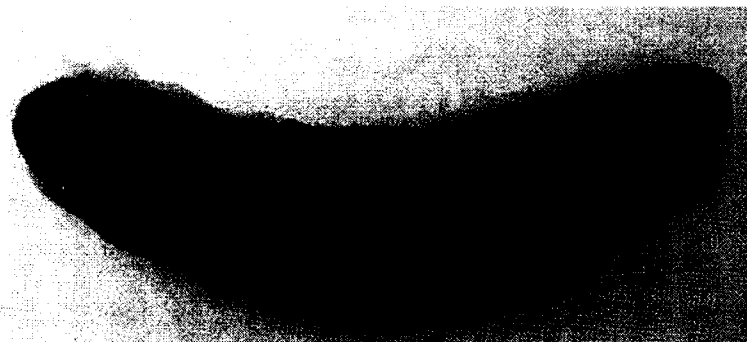
شکل ۱: خیار دریایی Holothuria sp.

خیار دریایی Holothuria sp. متعلق به خانواده Holothuridae می‌باشد. پراکنش این جنس بیشتر در مناطق گرمسیری و نیمه گرمسیری است و در ایران در سواحل جزر و مدی بندرلنگه و سیستان و بلوچستان و همچنین در آبهای کیش یافت شده است. تغذیه خیار دریایی از جلبکهای تک سلولی، دیاتومه‌های کفزی، پروتوزوآها، تخم ماهیها، لارو جانوران دریایی، پسماندهای ذرات آلی و موجودات کوچک دیگر است. خیارهای دریایی رسوبات دریا را بدون انتخاب می‌بلعند و مواد آلی موجود در آنها را جذب می‌کنند. این جانوران مقدار پانصد هزار تا یک میلیون کیلوگرم رسوب را در سال از روده‌های خود عبور می‌دهند. طول این جانور به ۳۰ سانتیمتر می‌رسد و پایکهای زیادی دارد که در سطح پشتی بدن به پاپیل‌هایی تبدیل شده‌اند که موجب زبری سطح بدن گردیده است. رنگ آن قهوه‌ای تیره بوده و داخل روده آن پر از شن و ماسه می‌باشد (شکل ۱). دستگاه تولید مثل این جانور شامل غدد تناسلی و لوله تناسلی است و تولید مثل از طریق لقاح خارجی صورت می‌گیرد (Kotpal, 1983).