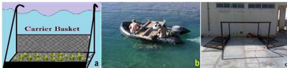
شکل ۲: سبد قدیمی انتقال مرجان (a و b) اقتباس از هاوایی (Carrier Basket) (Paul et al., 2005) و ساخته شده توسط کارشناسان موسسه تحقیقات علوم شیلاتی کشور در مرکز تحقیقات شیلاتی چابهار (c)