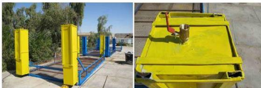
شکل ۴: طراحی و ساخت سبد جدید برای انتقال به نام حامل مرجان (Coral Carrier) Figure 4: Design and construction a new basket for the transfer (Coral Carrier)