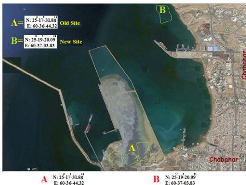
شکل ۳: موقعیت مرجان‌های محصور شده در نقطه A نسبت به سایت جدید نقطه B Figure 3: Position of the corals enclosed at point A relative to the new site point B