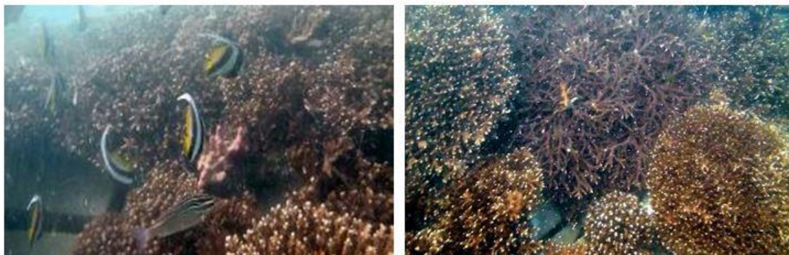
شکل ۷: تصاویری از پایش سایت مرجان ها در خلیج چابهار