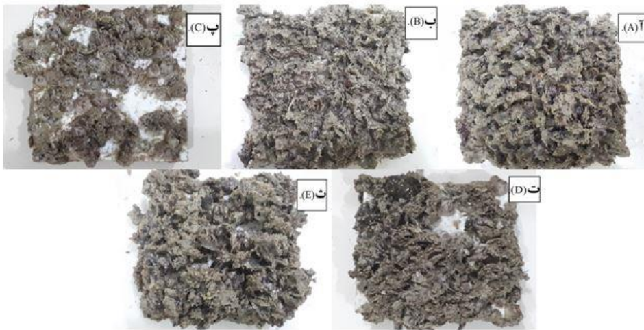
شکل ۱: فولینگ تجمع کرده بر پنل‌ها در پایان دوره آزمایش. آ: پنل بدون پوشش، ب: پنل کنترل، پ: پنل آنتی‌فولینگ ۱، ت: پنل آنتی‌فولینگ ۲، ث: پنل آنتی‌فولینگ ۳.