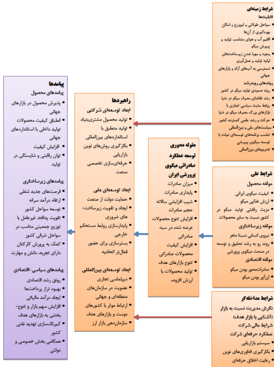
شکل ۲: پارادایم کدگذاری محوری Figure 2: Axial coding paradigm

۹- تصدیق مدل: برای اثبات مقبولیت و کاربردی بودن مدل، برای بار دوم با ۱۲ نفر از خبرگان قبلی، مدل مورد بحث و بررسی قرار گرفت و برای بار سوم مدل به ۸ نفر از آنها ارائه شد و مقبولیت و کاربردی بودن آن در این صورت محرز شد (شکل ۲).