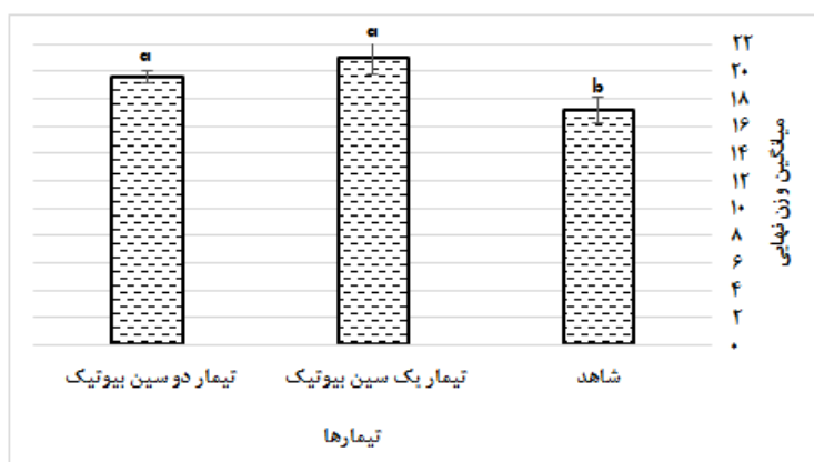
شکل ۱: مقایسه وزن نهایی بین تیمارها

مقایسه میانگین وزن نهایی بین تیمارها در پایان هفته هفتم در شکل (۱) نشان داده شده است. مقادیر وزن نهایی در هر دو تیمار یک و دو سین بیوتیک دارای افزایش معنی‌داری نسبت به گروه شاهد بودند ( p < 0.05 ). مقایسه شاخص‌های رشد و شاخص کبدی بین تیمارها در پایان هفته هفتم در شکل (۲) نشان داده شده است. طبق شکل