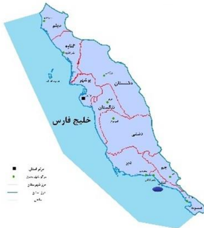
شکل ۱: نقشه منطقه مورد مطالعه در استان بوشهر - بندرکنگان

دامپزشکی پایش سلامت (ویرومد گیلان) منتقل شده و با استفاده از ضریب مندرج در کاتالوگ اندازه‌گیری شدند. جهت مقایسه آماری نمونه‌ها از نرم‌افزارهای EXCEL و SPSS نسخه ۲۰ و روش آماری آنالیز واریانس یک‌طرفه (ANOVA) استفاده گردید. به‌منظور تعیین وجود یا فقدان